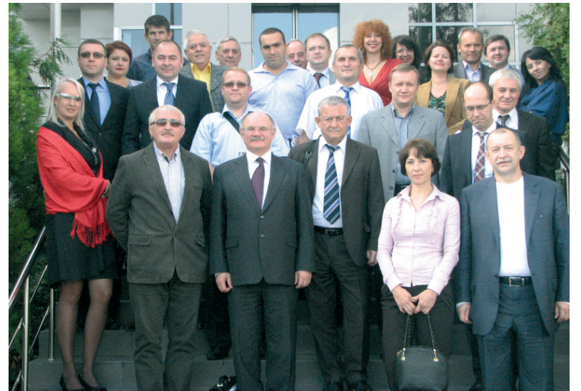
но ведущими морскими и портовыми компаниями города.

Гости и ведущие поделились своей озабоченностью перспективами работы в условиях ВТО: слишком мало конкретной информации о возможных негативных последствиях этого шага. Именно эти вопросы и будут рассматриваться на предстоящем в следующем году мероприятии, проведение которого инициировано Новороссийской ТПП и поддержа-